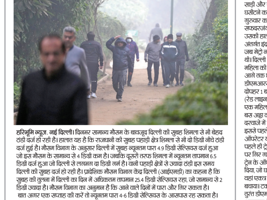
हरिभूमि न्यूज़ नई दिल्ली। विमानर सामान्य मौसम के बावजूद दिल्ली की सुबह शिमला से भी ठंडे ठंडे दर्ज हो रही है। हालात यह है कि राजधानी की सुबह पहाड़ी क्षेत्र शिमला से भी ठंडे ठंडे दर्ज हुई है। मौसम विभाग के अनुसार दिल्ली में सुबह न्यूनतम पारा 4.9 डिग्री सेल्सियस दर्ज हुआ जो इस मौसम के सामान्य से 4 डिग्री कम है। जबकि दूसरी तरफ शिमला में न्यूनतम तापमान 6.5 डिग्री दर्ज हुआ जो दिल्ली से लगभग दवा डिग्री गर्म है। यानी पहाड़ी क्षेत्रों से ज्यादा ठंडी इस समय दिल्ली की सुबह दर्ज हो रही है। प्रादेशिक मौसम विभाग केन्द्र दिल्ली (आईएसएमडी) का कहना है कि सुबह की तुलना में दिल्ली का दिन में अधिकतम तापमान 25.4 डिग्री सेल्सियस रहा, जो सामान्य से 2 डिग्री ज्यादा है। मौसम विभाग का अनुमान है कि आने वाले दिनों में पारा और गिर सकता है। बात अगर एक रातका की करें तो न्यूनतम पारा 4-6 डिग्री सेल्सियस के आसपास रह सकता है।