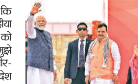
भजनलाल को मिला बरडे गिफ्ट भजनलाल शर्मा का आज ही जन्मदिन भी है। पीएम मोदी ने उन्हें बधाई दी है। पीएम ने कहा भजनलाल शर्मा को जन्मदिन की हार्दिक शुभकामनाएं।

भाजपा सरकार विकास में जी-जान से जुटी रहेगी